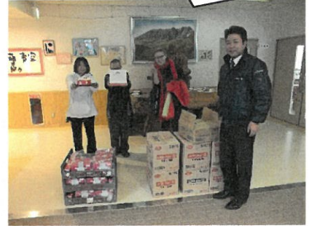
ケーキありがとうございました。

尚、今回は(株)ヤマザキ様よりケーキとお菓子の寄付をいただきました。ありがとうございました。